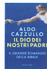
Il Dio dei nostri padri. Il... Aldo Cazzullo