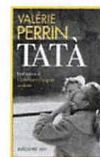
Tatà Valérie Perrin